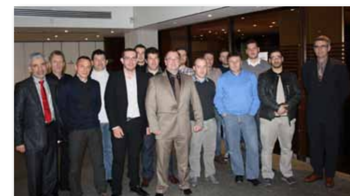
Stagiaires et jury au centre de formation du Gimssi

En effet, le corpus de cette formation inclut un chapitre sur la prévention des risques électriques. À l'issue de l'examen, une attestation est délivrée permettant aux chefs d'entreprise d'évaluer le salarié en vue de l'habiliter à des tâches précises. L'intégration des obligations réglementaire de formation dans un cursus pédagogique est une de nos demandes. Nos compagnons doivent posséder toutes les compétences obligatoires nécessaires à la pratique de leur métier dès leur sortie de l'école. Le développement de formations adaptées aux besoins des compagnons est un des objectifs prioritaires du GIMSSI et se situe dans le prolongement de notre activité syndicale. Développer cet outil de formation en répondant aux problématiques identifiées avec nos adhérents a toujours été notre priorité.