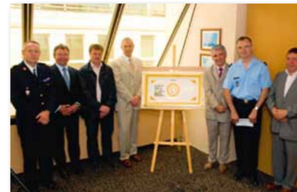
Cérémonie de remise des droits de l'auteur du Guide pratique aux œuvres des sapeurs pompiers.