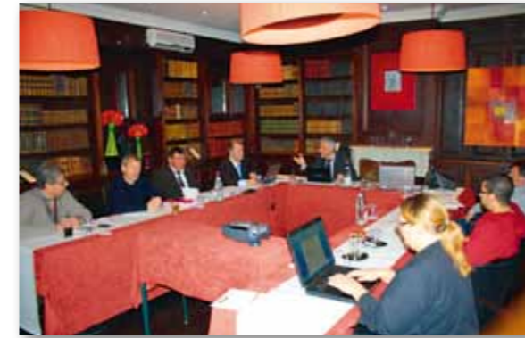
Réunion mensuelle du Gimssi : tous les adhérents de la FFB sont invités à participer aux réunions techniques du GIMSSI. Le calendrier est précisé sur le site www.gimssi.fr