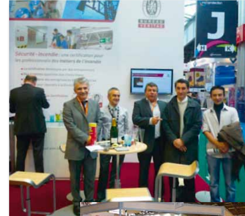
2 stands Gimssi au salon ExpoProtection 2010 à Villepinte (avec Bureau Veritas Certification et avec le SVDI)